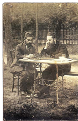
Skrychiszyn nad Bugiem. Lata 20.