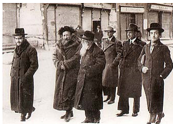
Myślenice 1920. Żydzi wracają z Synagogi.