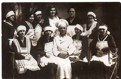
Pracownicy piekarni. Zduńska Wola.

Opracowano w ramach projektu "Badanie postaw wobec Żydów i stosunku do ich dziedzictwa, współpraca z lokalnymi partnerami w wybranych 15 miejscowościach, edukacja dla tolerancji", realizowanego przez Fundację Ochrony Dziedzictwa Żydowskiego dzięki wsparciu Fundacji im. Stefana Batorego.