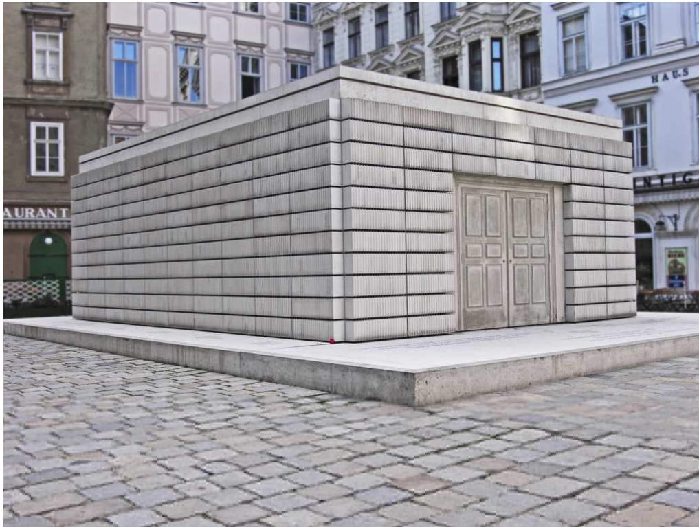
Rachel Whiteread, Pomnik Holokaustu, Wiedeń, 2000