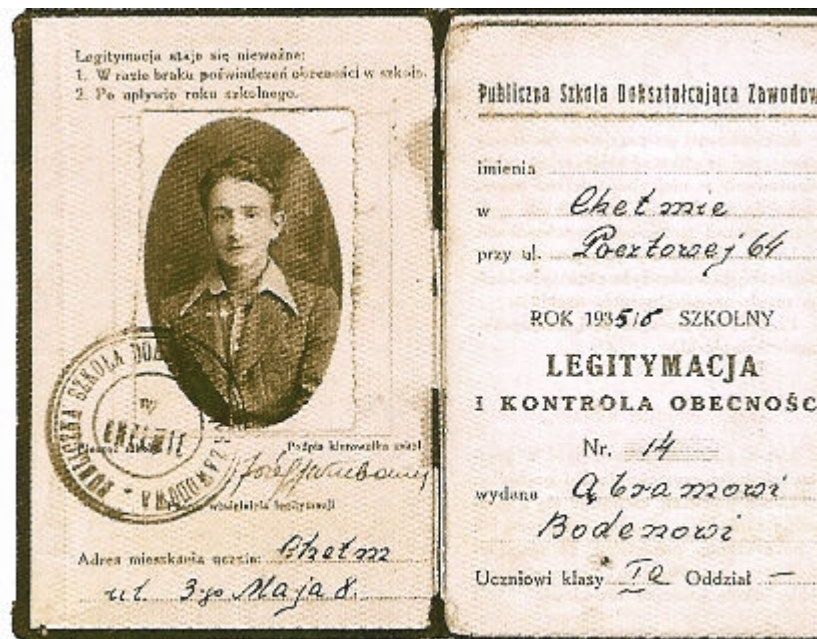
Legitymacja Publicznej Szkoły Dekszałkującej Zawodowej Abrahama Bodena - 1935 rok.