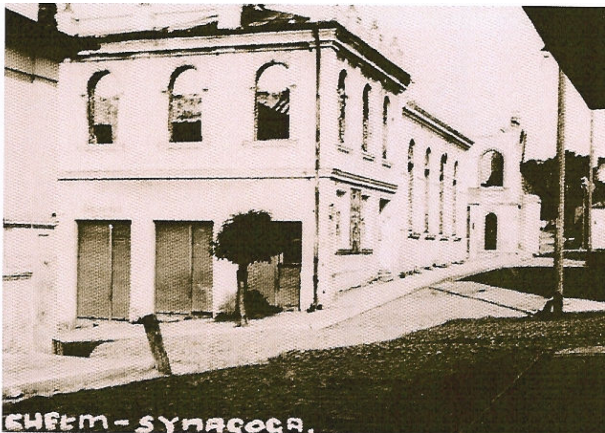
Synagoga przy ulicy Kopernika - początek lat 40. XX wieku.