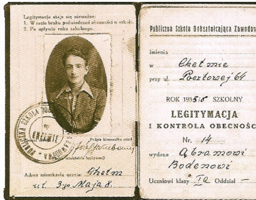
Legitymacja Publicznej Szkoły Doksztalującej Zawodowej Abrahama Bodena - 1935 rok.