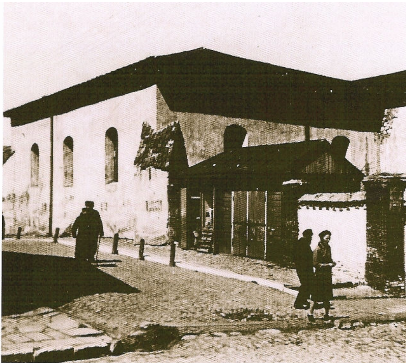
Widok na starą synagogę - koniec lat 40. XX wieku.