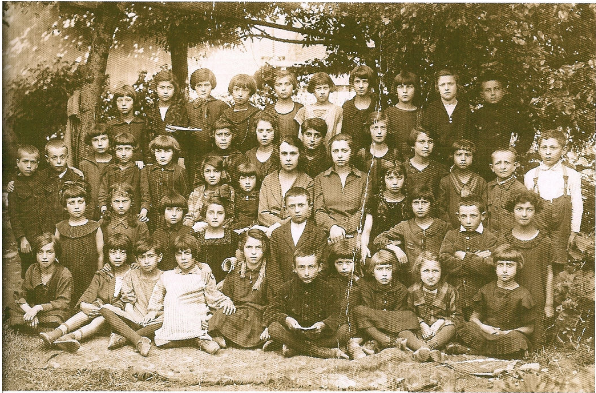
Grupa dzieci szkolnych - okres międzywojenny.