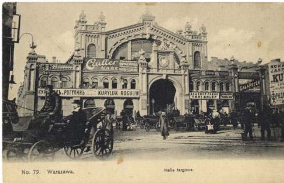
Hala Mirowska

Nie mieszkali tam jednak zbyt długo, ponieważ po zdobyciu Warszawy przez Niemców w 1915 roku, dwa lata później, matka Isaaca zabrała go wraz z jego młodszym bratem i wyjechała do rodziny w Biłgoraju. Po wojnie Isaac wrócił do stolicy niepodległej Polski, ale już nie na Krochmalną.