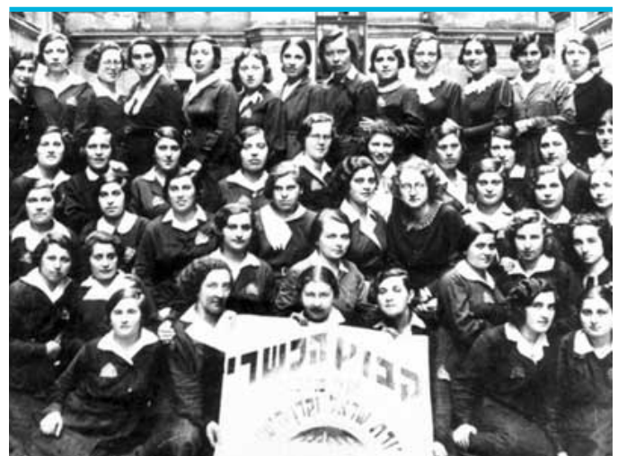
Druga z kolei klasa kończąca szkołę Bejs Jaakow w Łodzi, 1934