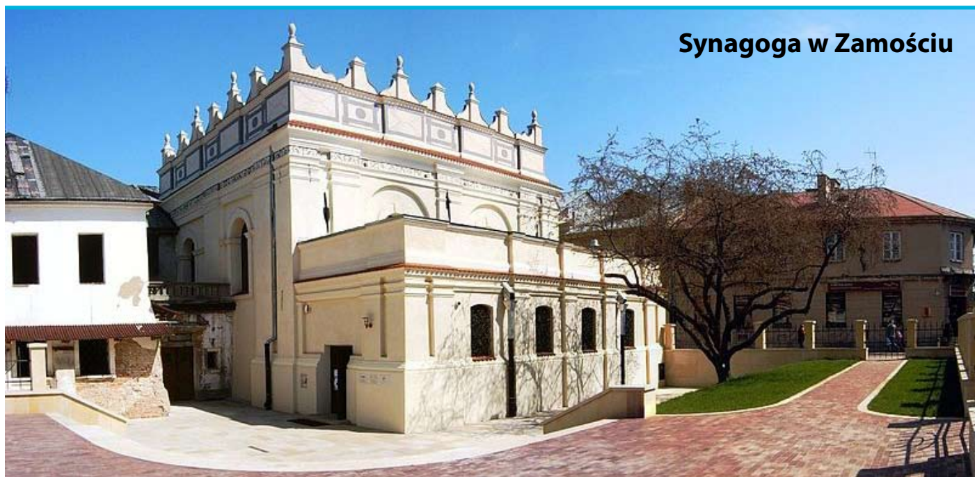
Synagoga w Zamościu

Działania Fundacji obejmują także rewitalizację szczególnie ważnych i wartościowych zabytków kultury żydowskiej, takich jak synagogi w Kraśniku, Łańcucie, Przysusze i Rymanowie, a także synagoga w Zamościu. Projekty rewitalizacji synagog w Zamościu i Kraśniku realizowane są w ramach „Szlaku Chasydzkiego”. Szlak Chasydzki to projekt realizowany przez Fundację od 2005 r. Jego celem jest wytyczenie międzynarodowego szlaku turystycznego łączącego miejscowości położone w południowowschodniej Polsce i na zachodniej Ukrainie, w których znajdują się zabytki kultury żydowskiej. Prace budowlane i konserwatorskie synagogi w Zamościu rozpoczęły się w lipcu 2009 r. i zostały zakończone w 2010 r. Uroczystość otwarcia Centrum „Synagoga” 5 kwietnia 2011 r. zo-