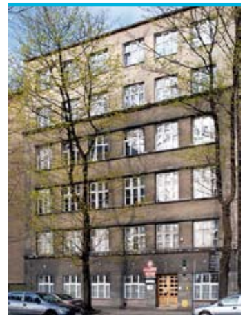
Dawna siedziba Wyższych Kursów Nauczycielskich Bejs Jaakow przy ul. św. Stanisława 10 w Krakowie

Zmarła 1 marca 1935 r. i została pochowana na nowym cmentarzu żydowskim w Podgórzu. Jej grób został zniszczony, gdy hitlerowcy założyli na terenie cmentarza obóz koncentracyjny Płaszów. W 2004 r. na cmentarzu umieszczono upamiętniającą Sarę Szenirer symboliczną macewę.