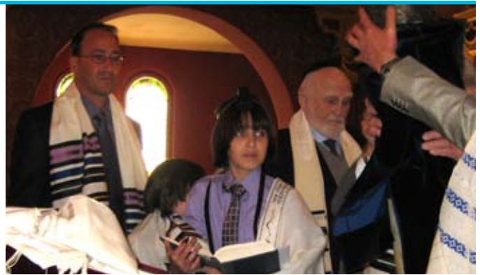
Bar Micwa Zacharego w synagodze Tempel

owoców uważając je za niezdatne do jedzenia. Ponieważ człowieka często porównuje się w Torze do drzewa, tak samo przez pierwsze trzy lata chłopca traktuje się jako niegotowego do duchowego zmierzenia się z rzeczywistością. Jego charakter nie jest jeszcze ukształtowany, jego natura jest nie ujarzmiona i daje swój wyraz, potrzeba zaspokajania cielesnych potrzeb bierze górę, a wewnętrzne siły są niczym nie tłumione. Dodatkowo on sam nie jest w stanie wyrażać jeszcze swoich uczuć za pomocą słów, tym samym trudniej mu konstruować własne myśli. Chłopiec dopiero gdy dorasta i jest trochę starszy może zostać poddany edukacji. Tak jak drzewo nie będzie rosło na słabo osadzonym korzeniu bo zwali się pod wpływem byle wiatru - tak małe dziecko łatwo zagubi się w świecie, gdy przedwcześnie zacznie się ingerować w jego naturę.